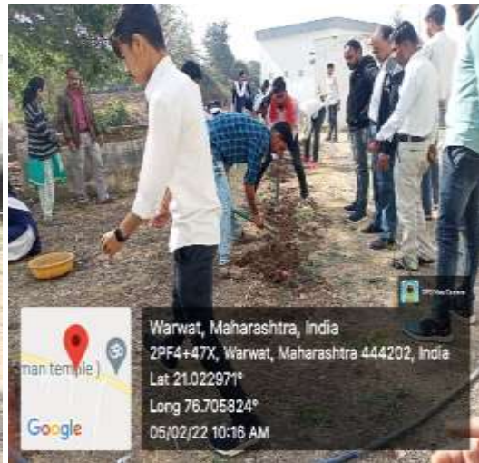
Warwat, Maharashtra, India 2PF4+47X, Warwat, Maharashtra 444202, India Lat 21.022971° Long 76.705824° 05/02/22 10:16 AM