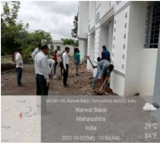
MH 54 195, Warwat Bakal, Maharashtra 444202, India Warwat Bakal Maharashtra India 29°C 84°F 2021-10-02(Sat) 10:56(AM)