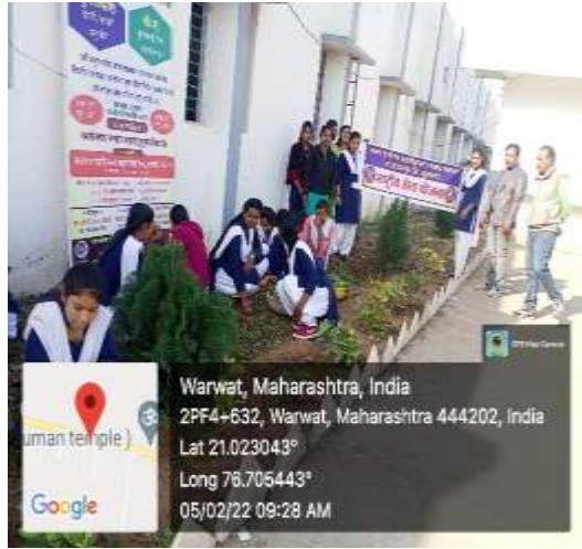
Warwat, Maharashtra, India 2PF4+632, Warwat, Maharashtra 444202, India Lat 21.023043° Long 76.705443° 05/02/22 09:28 AM