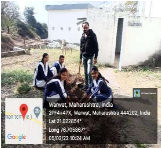
Warwat, Maharashtra, India 2PF4+47X, Warwat, Maharashtra 444202, India Lat 21.022854° Long 76.705867° 05/02/22 10:24 AM